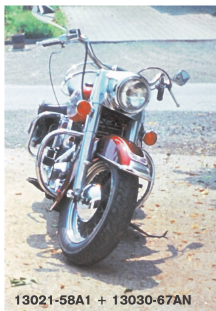
13021-58A1 + 13030-67AN