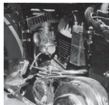
Katalog Stand 09/17, Seite 255