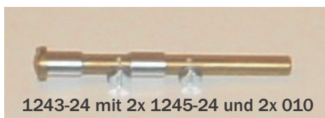
1243-24 mit 2x 1245-24 und 2x 010