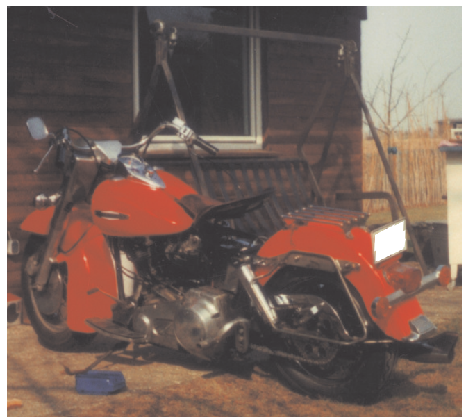
Katalog Stand 03/19, Seite 507